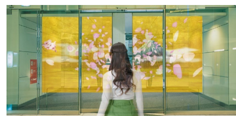
自動ドアが開き始めた時 ※イメージ画像