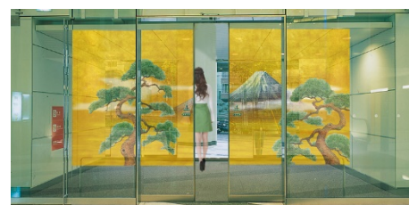
自動ドアが閉じ始めた時 ※イメージ画像

「コネクトドア™」は、国内自動ドアトップシェアのナブテスコが長年培ってきた駆動制御技術と凸版印刷が持つ、システム開発技術力、映像制作力を組み合わせることで、商業施設や観光施設などに設置されている自動ドアをはじめとしたエントランス空間を静的な空間から動的な空間へと変化させることができる新たな映像ソリューションです。自動ドアに投影された映像と空間を一体化させ、エンターテインメント空間や広告スペースに活用することができます。