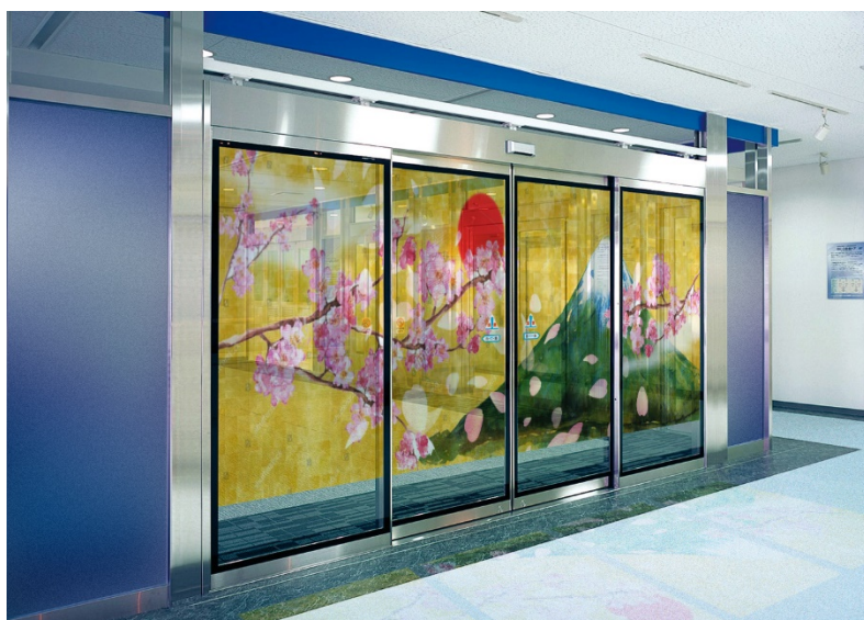
「コネクトドア™」 ※イメージ画像

今後、共同で実証実験を行うとともに、空港、ショッピングモール、アミューズメントスペースなどの商業施設、ショールーム、観光関連施設向けに2018年12月から試験販売を開始します。