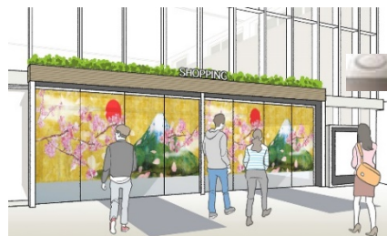
商業施設での活用