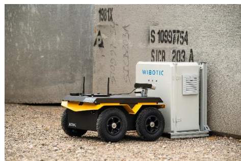
AGV（無人搬送車）の充電での活用例