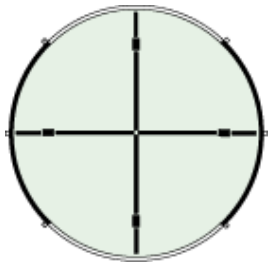
プラスポジション